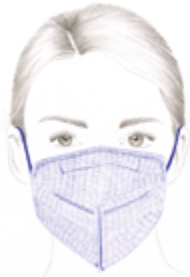
FFP2 of FFP3 zonder ventiel