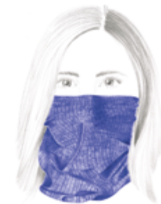
Sjaal of bandana