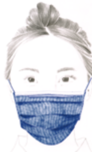
Zeer dun textiel masker met kwalitatieve filter