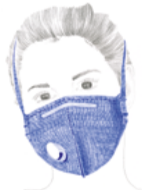
FFP2 of FFP3 met ventiel